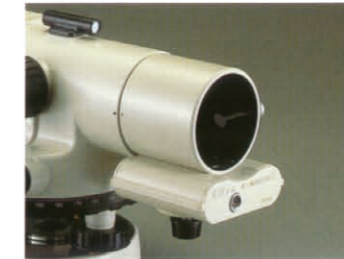
オプティカル照明装置3型(オプション)

単三形乾電池で簡単に使える照明装置(ASシリーズと共用)。望遠鏡の先端に取り付けて、望遠鏡の十字線を照明します。