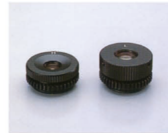
望遠鏡接眼レンズH/L(オプション)

ネジ込み式で交換が簡単な交換用接眼レンズを、高倍率(H)/低倍率(L)の2種類をご用意しました。ダイアゴナルアイピースの取り付けも可能で、使用範囲は一層大きく広がります。