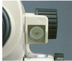
気泡管用ペンタミラー

視準の姿勢を変えずに、ちょっと視線をズラすだけで気泡像が見られる、気泡管用ペンタミラーを採用。像は正像ですから、まぎらわしさもありません。