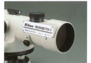
オプティカルマイクロメーター3型(オプション)