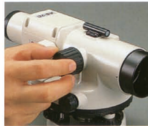
一軸粗微動合焦方式

粗動と微動、2つの機能を備えた一軸粗微動合焦方式。スピーディ、かつ確実なピント合わせが行えます。