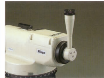
ダイアゴナルアイピース(オプション)