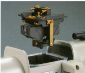
エアードンパー方式コンベンセーター

補正鏡は望遠鏡の平行光束中にあり、本機の傾きによる補正鏡の位置変化時の補正誤差、ピントのズレによる像のボケは生じません。また、振子は特殊弾性リボン材で逆台形に吊られており、本機の傾きに対し6倍の敏感さで補正します。さらに、使用条件に左右されず永久的に制動効果を発揮する空気制動方式ダンパー、エアースキ間が広く微振動の制動にも効果がある特殊構造のピストン・シリンダーを採用しており、常に安定した精度を維持します。