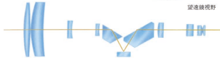
明るくシャープな望遠鏡光学系