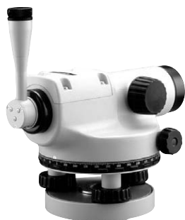
ダイアゴナルアイピース(オプション)