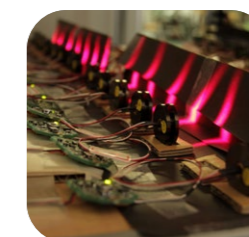
レーザー耐久試験