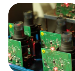
回転ヘッド耐久試験