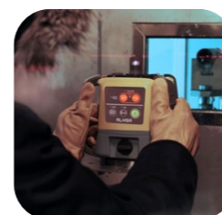
恒温恒湿試験・低温試験

現場で使用する機械は信頼性が第一と、トプコンは考えます。そこで、製品を安心して長期間お使いいただけるよう、過酷な現場を想定した耐環境試験を実施しています。RL-H5A は、専用の検査装置により防塵・防水性能を徹底検証するだけでなく、振動・落下・温度・湿度など多岐にわたる試験をクリア。トプコンのローテーションレーザー史上、最高レベルの耐久性を実現しています。